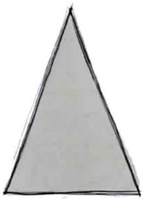
RZUT Z GÓRY