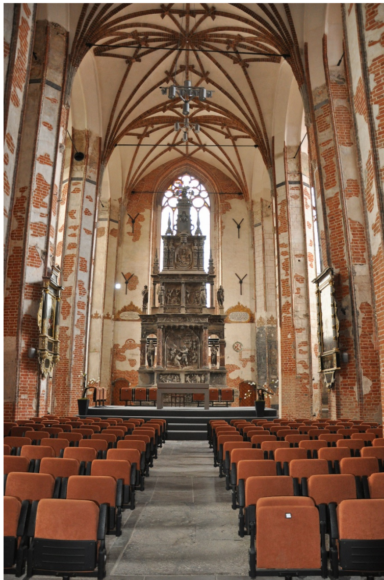
Ryc 3. Nawa i ołtarz kościoła św. Jana w Gdańsku

jeszcze jeden punkt w czasie istotny dla późniejszego znaczenia wyroku tego sądu. To moment kodowania informacji o istotności, a więc chrzest, jako nadanie sensu życiu nowej istoty (w projekcie METAMISTIC – zakodowanie informacji art-DNA dla dzieła sztuki). Zazębianie się tych znaczeń w kulturowym kręgu naszej cywilizacji skłoniło autorów projektu Metamistic do wyboru Kościoła Św. Jana w Gdańsku (miejsca łączącego religię z kulturą i sztuką) jako miejsca namalowania symbolicznej kostki/kursora. Ołtarz Abrahama van den Blocke w tym kościele ukończony w roku 1611 poświęcony jest właśnie Janowi Chrzcicielowi i symbolicznemu aktowi chrztu-nadania nowego sensu istnienia już żywej istocie. Tak w chrześcijaństwie jak w koncepcji projektu METAMISTIC ten symboliczny gest rozszerza istnienie poza ciało/formę artystyczną do szerszego kontekstu czasowego.