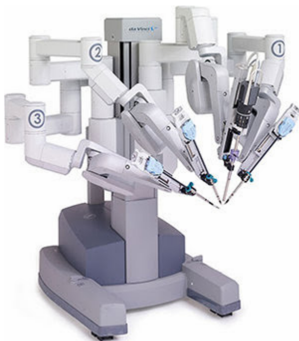
Ryc 2. Stacja dokująca robota chirurgicznego Da Vinci (przykład robota chirurgicznego)