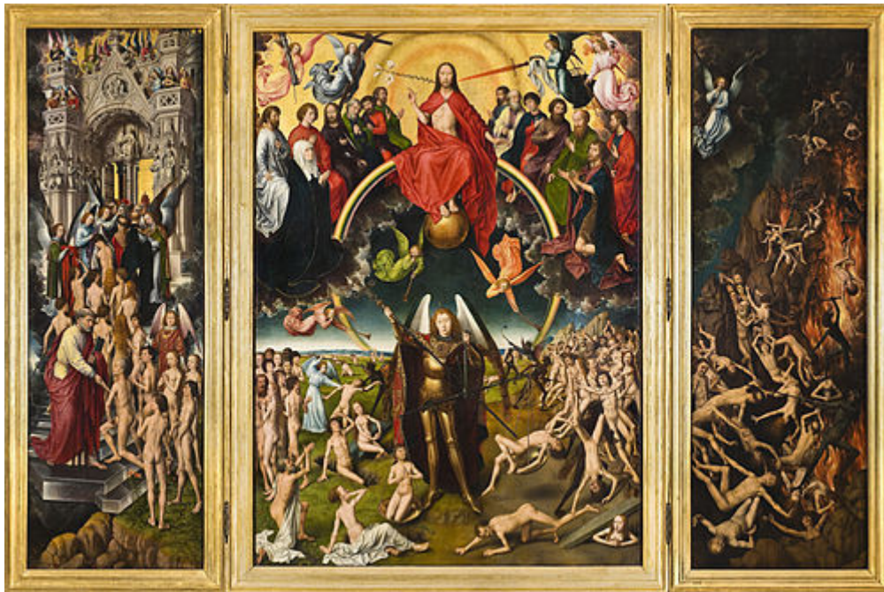
Ryc 4. Hans Memling, Sąd Ostateczny (1467-1471)

Jednocześnie podczas malowania kostki w rozpylonej nad ołtarzem mgłę pojawi się projekcja obrazu Hansa Memlinga Sąd Ostateczny. Pierwotne pojawienie się ołtarza z symboliką chrztu/nowego sensu istnienia płynnie przejdzie tu w symbol sądu ostatecznego, który oceni sens tego aktu/działania.